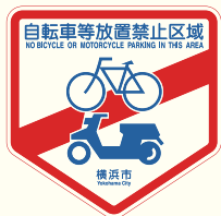
禁止停放区域指示牌

横滨市在车站周围的公共场所指定有“禁止停放自行车区域”， 并将对擅自放置的自行车或摩托车移动保管。 ※办理退还手续时需要缴纳保管手续费。